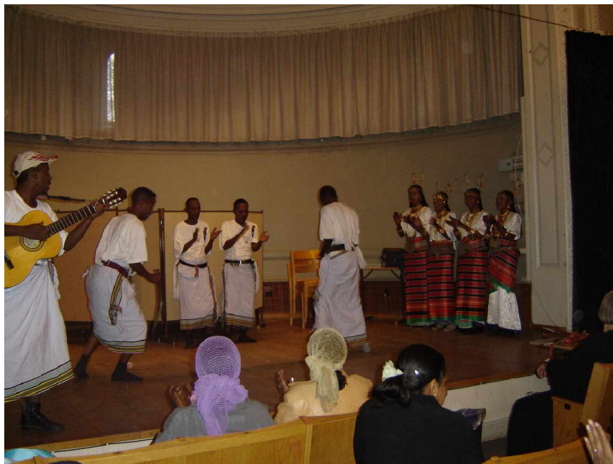
Uppträdande i en Gymnasieaula i Nyköping

På kvällen den 3é genomfördes en informationsinsatts och uppträdande av kulturgruppen inför ett 50-tal åhörare i en gymnasieskola i Nyköping