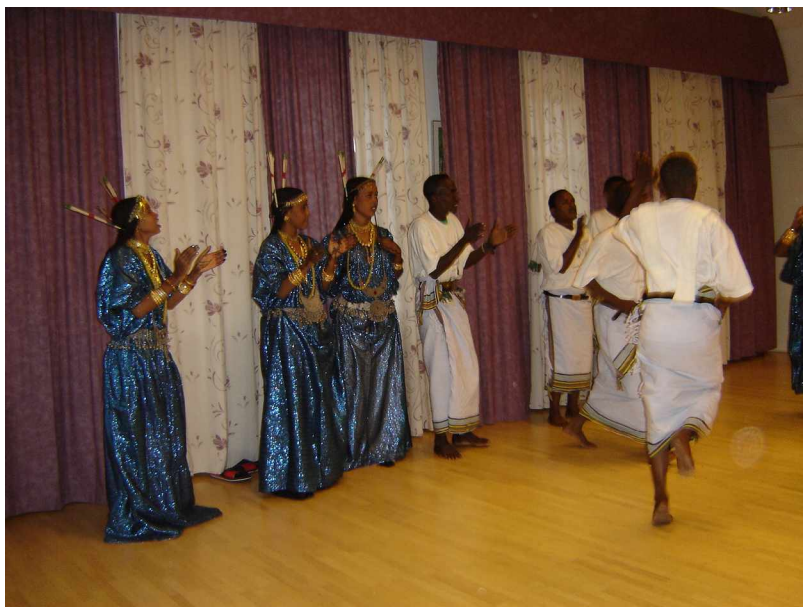
Enköpings Folkets Hus

Upptredande och information i Folkets Hus Enköping. I Enköping sjöng också flickorna för första gången hyllningssången till ABF som komponerats i Djibouti.