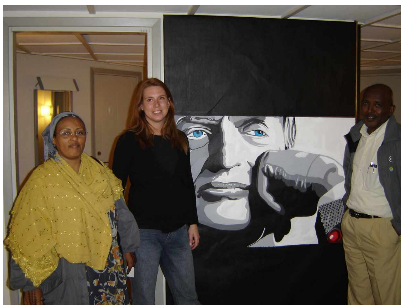
Olof Palme Center

Vi tycker att det är viktigt att ABF finnas på plats och planerar att använda de ungdomar som var med till Sverige som tänkta ABF ledare och informatörer i Djibouti