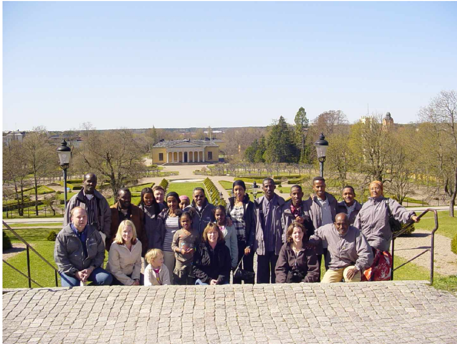
Vid slottet i Uppsala

Guidad tur med fransktalande guide i Domkyrkan och runt slottet och universitetet. Efter turen åkte vi till Gränby centrum för shopping På kvällen hölls en avslutningsfest på ABF expeditionen och vi hade en utvärdering av veckan som gått och inför framtiden