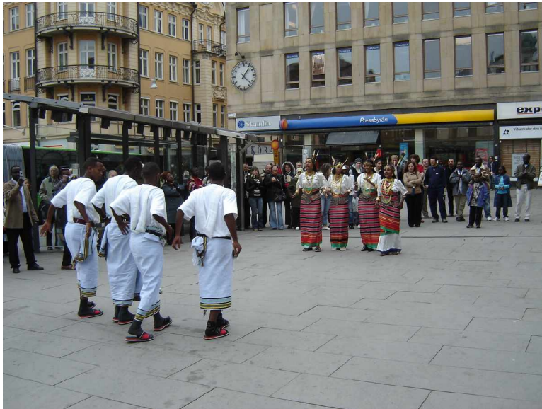
Stora Torget i Uppsala

Dans och informationsinsatser på stora torget i Uppsala i samband med Clean the city, på torget fanns också en Latinamerikansk dansgrupp från Bolivia Chasqui.