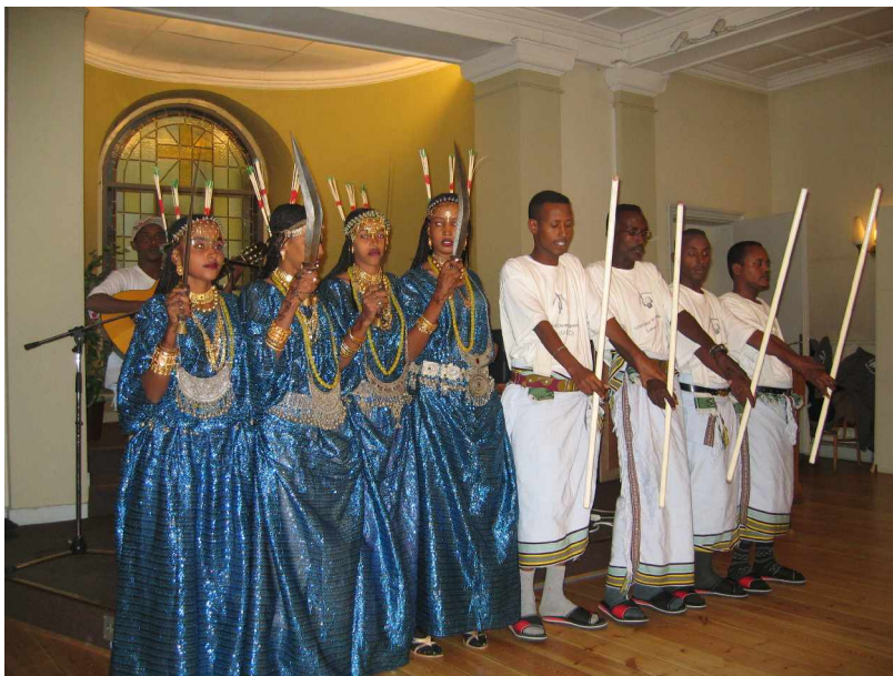
Föreläsning med Kulturkväll i Uppsala

Arrangemanget avslutades med en sång och dansföreställning utav kulturgruppen från Afrikas horn samt en Latinamerikansk dansgrupp från Uppsala föreningen Bolivia Chasqui.