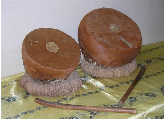
Dinkaará reedáh astá

dinkaará kak ane wayta Dardaarinni ane wa'am deqsitta. Dumi wakti kaadu kallaytuk sugte Qadqalum 12 deqsitah yan Dardaarak wadir dinkaará nacaasak he'en.