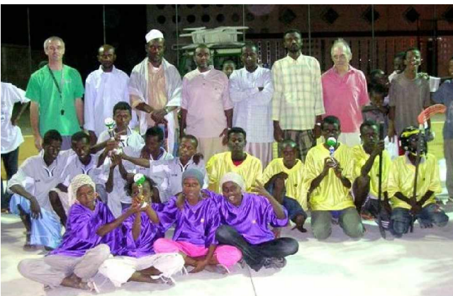
Teyse dokonu: Bad Boys, Bankuwaalé, Ummá