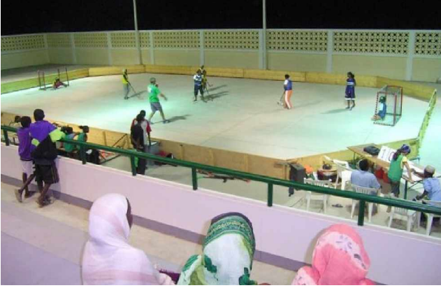
Togorri koqsô booxál tekke unihokkey celeemannu

Aybad: Ellecabóh abten digirit neh yabtu maay dudda?