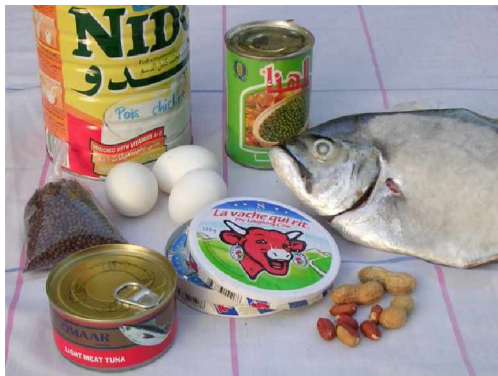
Cadó, kulluumu, naalá, cana, gubni, qadasa, soojá, qatrá (petit pois), aarashiidi.

Proteinitté edde maggo maaqidditté tah teeti: