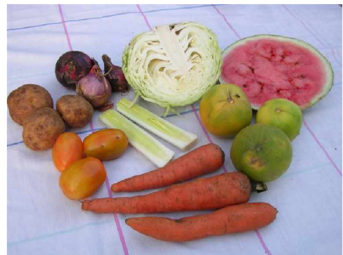
Cadó (kaxxi kaxxi tiró), dorrahí, naalá, kulluumu, gubni, cana, caxaaxuwa (kudrá,axcih anxax caffá leemi), caxâ-mixitté kee inki tan murtittéy xalse we'eni.

Proteinitté kee maqdanitté gaddaliinó le maaqidditté, usun: