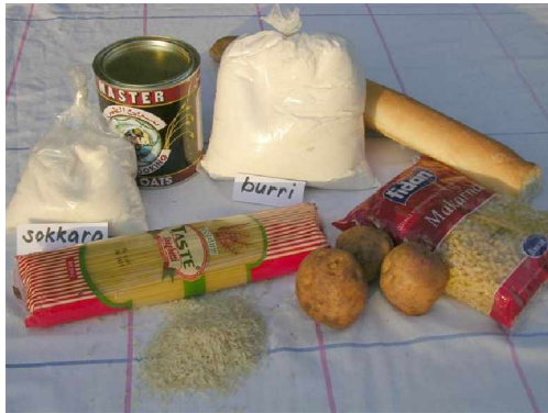
Bataatá, burri cabuubu (shaqiiri, bastá, burri, ruddi) kee daró.

Karboon alginaanitté le maaqidditté tah teeti :