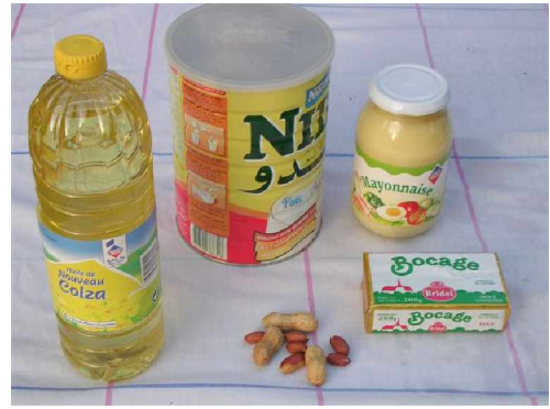
Saliiti, subaaca, aarashiidi, « avocats », canay ruke we'eni.

xagaanam (yakmeenim) faxximta. Sumuditté edde nabam maggo maaqidditté, usun: